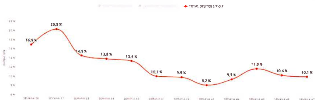
GRÁFICO DE EVOLUCIÓN PARA LOS DELITOS VIOLENTOS, CONTRA LA PROPIEDAD Y TOTAL DELITOS S.T.O.P