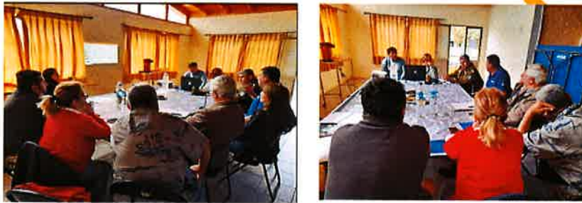
SE REALIZO MESA DE TRABAJO EN LA JUNTA DE VECINOS NRO.1 LA LAGUNA, CON LOS PRESIDENTES DE LAS JUNTAS DE VECINOS Y ORGANIZACIONES SOCIALES, ADEMAS DE LOCATARIOS DE LA LAGUNA.