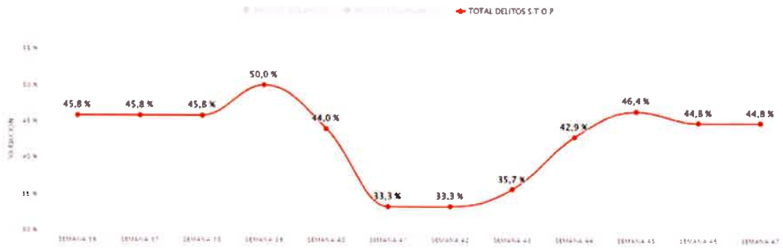
GRÁFICO DE EVOLUCIÓN PARA LOS DELITOS VIOLENTOS, CONTRA LA PROPIEDAD Y TOTAL DELITOS S.T.O.P